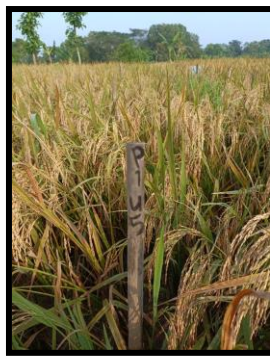
1.00 dosis NPK