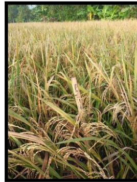
1.00 dosis NPK + 1.00 dosis pupuk SIMBIOS